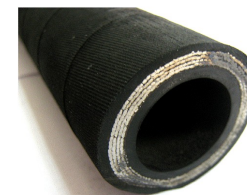
crevo V4 (4SP/SH)