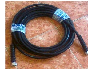
creva za pranje vruća i hladna voda

Creva sa jednim i dva žičana platna za vruću ili hladnu vodu