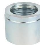
čaura no skive