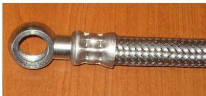
priključak "A" GČ