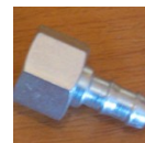
GČ crevo sa "J" priklj.