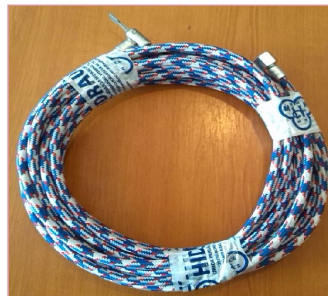
crevo za duvanje guma