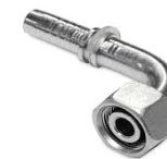
priključak A2 DKOL 90°