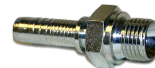
priključak F5 (AGR)